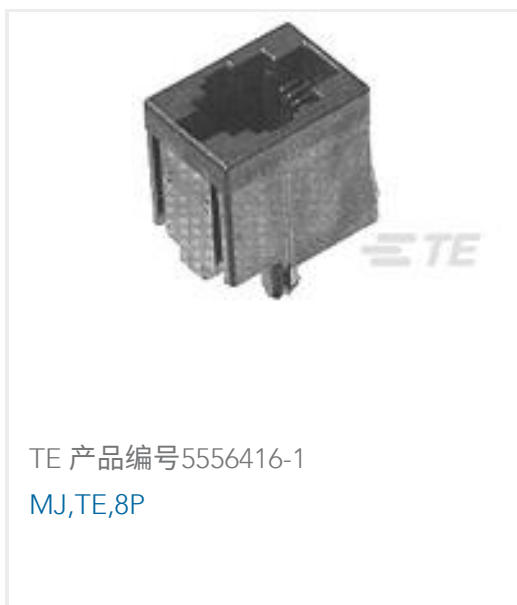
TE 产品编号5556416-1 MJ,TE,8P