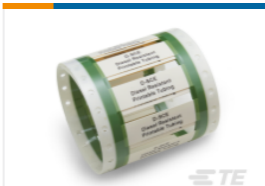
TE 产品编号 EC1920-000 D-SCE Fluid Resistant Sleeves