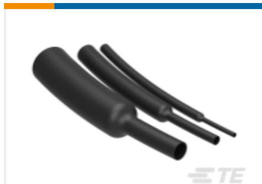
TE 产品编号 9661904001 CGPT 2:1 热缩管