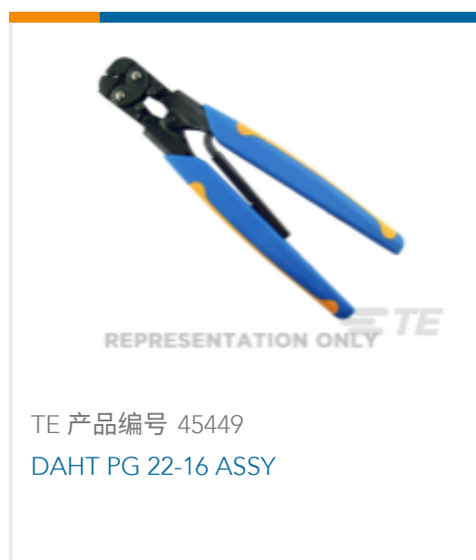
TE 产品编号 45449 DAHT PG 22-16 ASSY