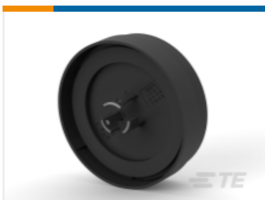
TE 产品编号2328118-2 LUMAWISE ENDURANCE N SHORTING CAP W/SUR