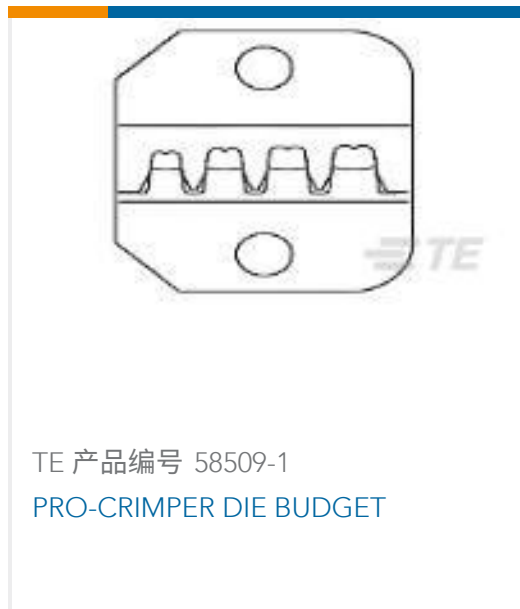
TE 产品编号 58509-1 PRO-CRIMPER DIE BUDGET