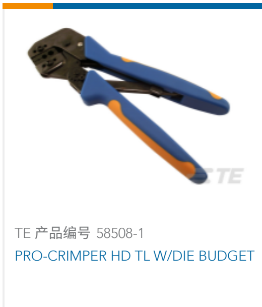
TE 产品编号 58508-1 PRO-CRIMPER HD TL W/DIE BUDGET