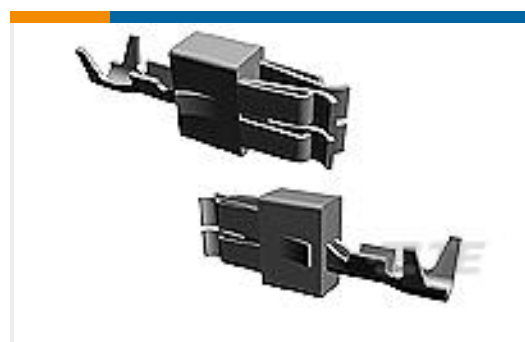
TE 产品编号927840-5 SPT REC 6.3 Contact SRC Ag