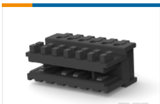
TE 产品编号2-293153-6 DUOPLUG 2.5 STD KEYED CTCS SELEC. LOADED