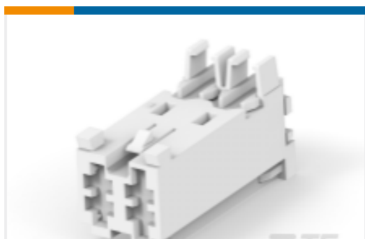
TE 产品编号7-2293382-2 AMP MONO-SHAPE TAB CONN 2P GW-V0