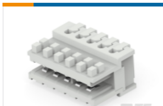
TE 产品编号4-2402722-5 Same as 4-284932-5 w/ alternative resin