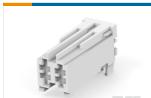
TE 产品编号6-2293382-2 AMP MONO-SHAPE TAB CONN 2P. G