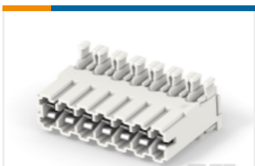
TE 产品编号2293372-7 AMP MONO-SHAPE PCB CONN SELEC. LOADED