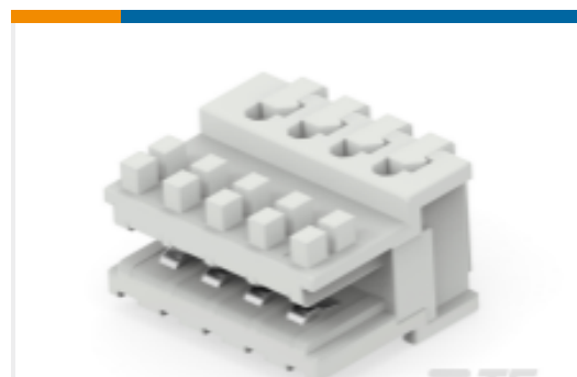
TE 产品编号2402726-4 Same as 284930-4 w/ alternative resin