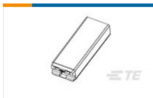
TE 产品编号2-1644125-3 SLEEVE ESPRING 250 NYLON DARK GRY