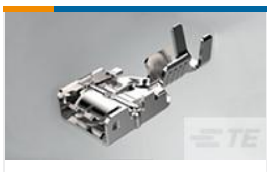
TE 产品编号336076-5 250 FASTON,E SPRING REC.,17-14 AWG,PNST