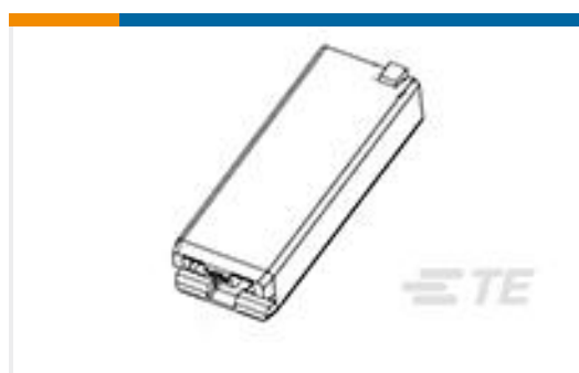
TE 产品编号2-1644125-4 SLEEVE EPRING 250 PA DARK GRY