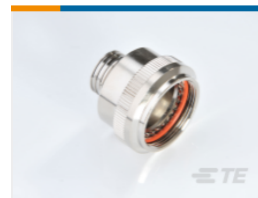
TE 产品编号70H1-19-16-1-B 70H1-19-16-1-B