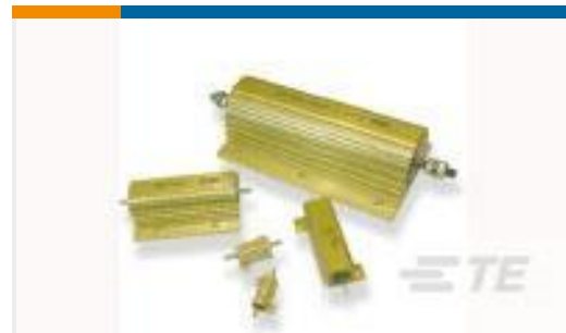
TE 产品编号 1-1625966-7 HSA10 1R5 5%