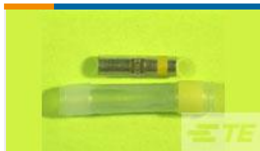
TE 产品编号 650075-000 D-436-37