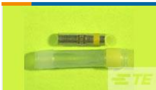
TE 产品编号 650076-000 D-436-38