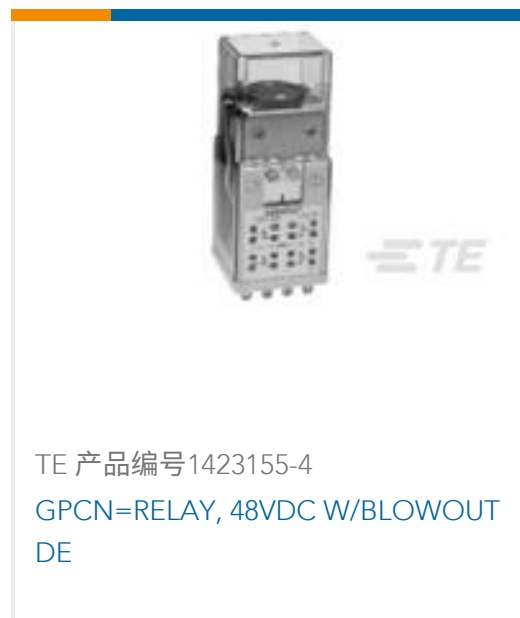
TE 产品编号1423155-4 GPCN=RELAY, 48VDC W/BLOWOUT DE