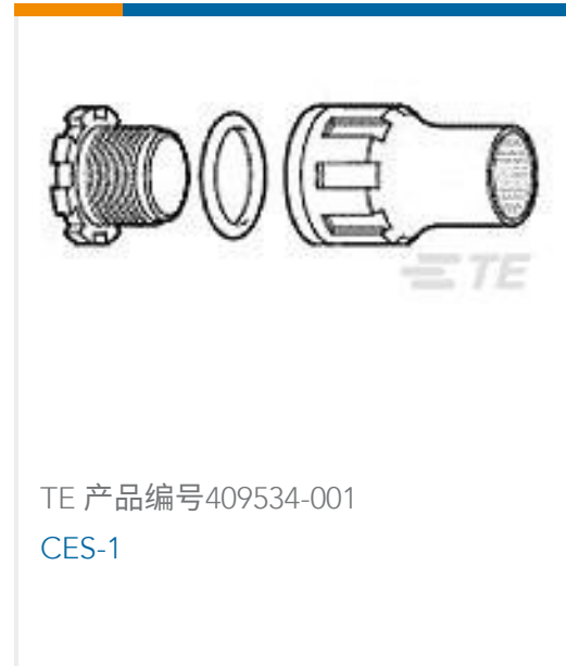
TE 产品编号409534-001 CES-1