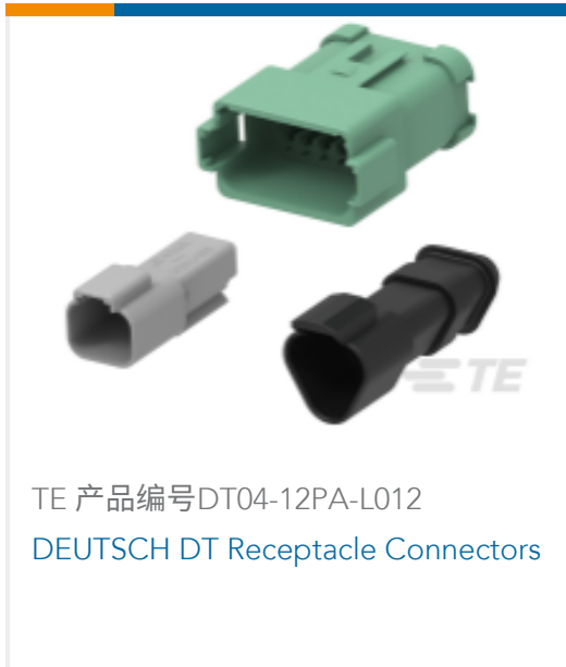
TE 产品编号DT04-12PA-L012 DEUTSCH DT Receptacle Connectors