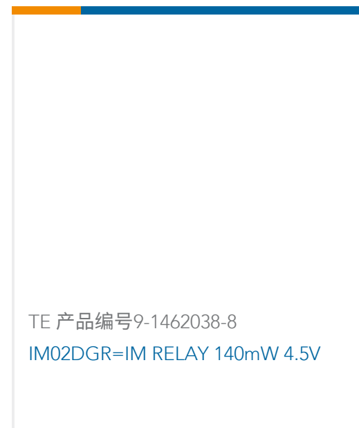
TE 产品编号9-1462038-8 IM02DGR=IM RELAY 140mW 4.5V