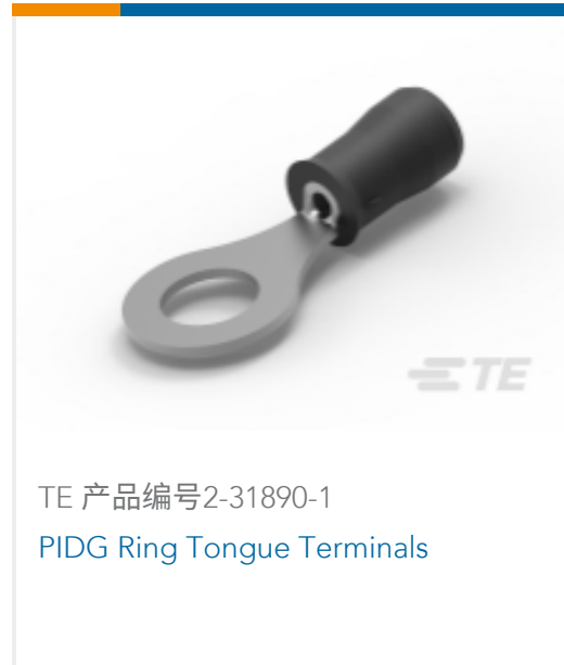
TE 产品编号2-31890-1 PIDG Ring Tongue Terminals