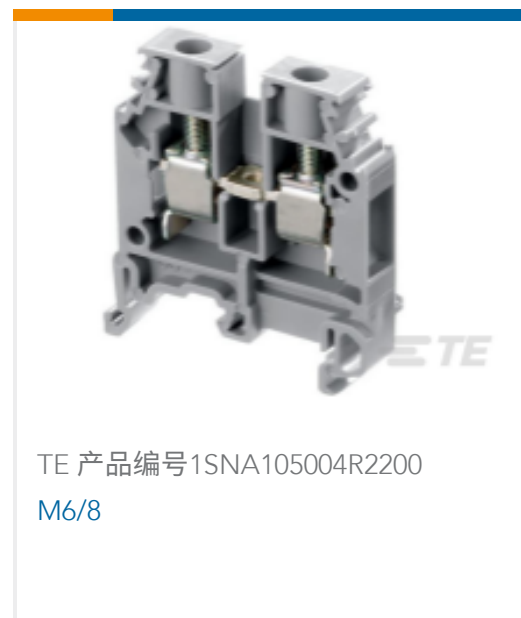
TE 产品编号1SNA105004R2200 M6/8