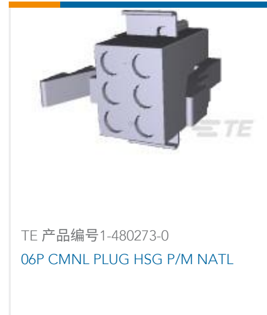
TE 产品编号1-480273-0 06P CMNL PLUG HSG P/M NATL