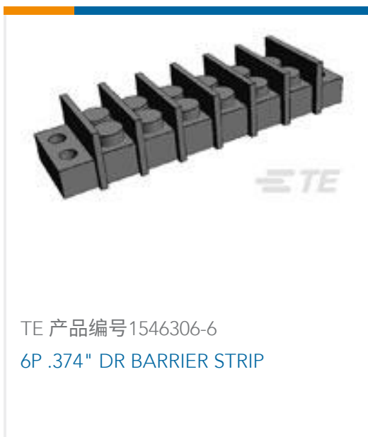
TE 产品编号1546306-6 6P .374" DR BARRIER STRIP