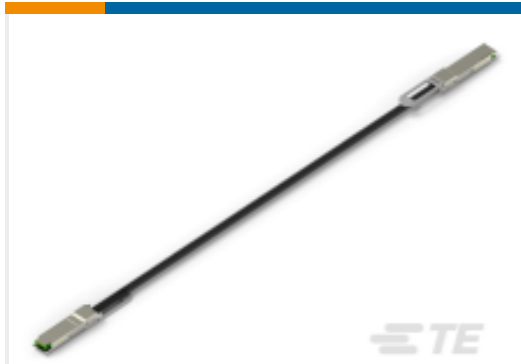
TE 产品编号2333393-7 QSFP 25GIG 30AWG 3 METER