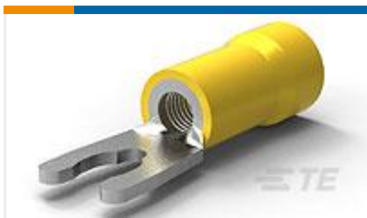
TE 产品编号53247-1 TERMINAL,PG SPR SPD 12-10 8