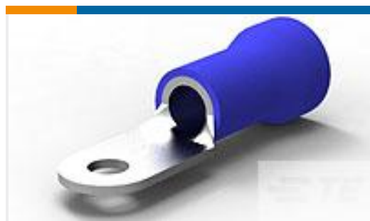
TE 产品编号52265 TERMINAL R PG 6 10