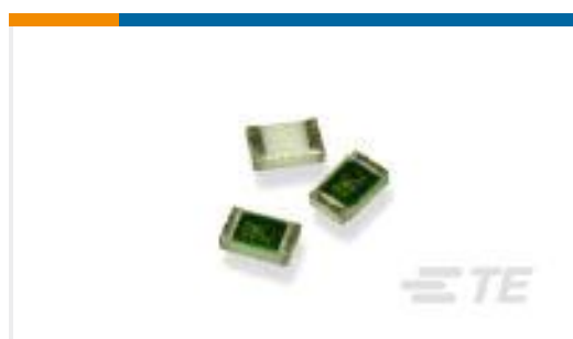
TE 产品编号8-1614881-8 CPF 0603 1K8 0.1% 25PPM 5K RL