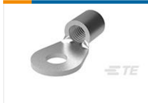
TE 产品编号36917 TERMINAL,SOLIS R 1/0 3/8