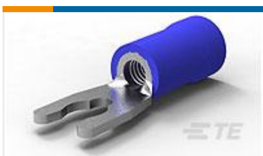
TE 产品编号52955 TERMINAL,PG SPR SPD 16-14 6