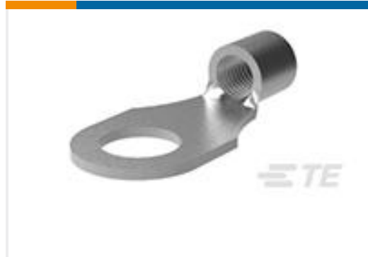
TE 产品编号321880 TERMINAL,SOLIS R 4/0 1/2