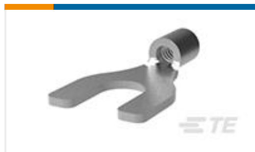
TE 产品编号323127 SOLIS SPD 22-16COMM 22-18MIL 6