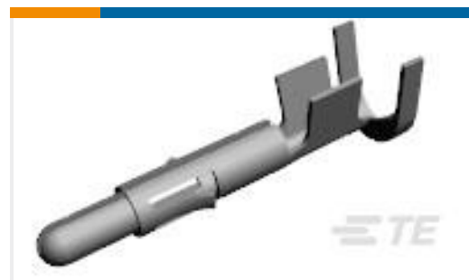
TE 产品编号350918-3 UMNL PIN 18-14 PTPPHBZ