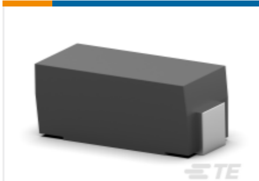
TE 产品编号5-2176460-5 SMF 7W 200K 5% Taped