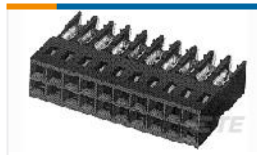
TE 产品编号102393-6 16 AMPMODU MT ASSY DR .100CL