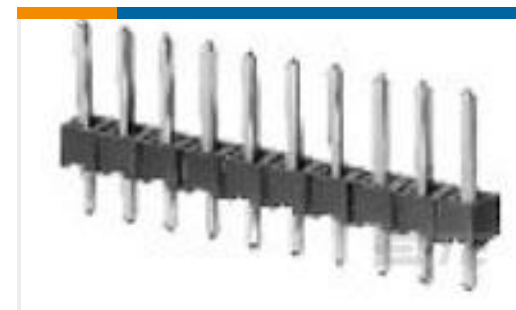
TE 产品编号6-146280-5 15 MODII HDR SRST B/A .100CL