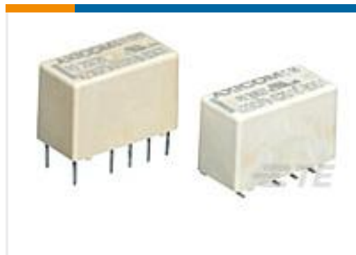
TE 产品编号2-1393789-2 V23079H1205B301