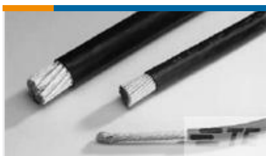
TE 产品编号290090-002 10603-4-0