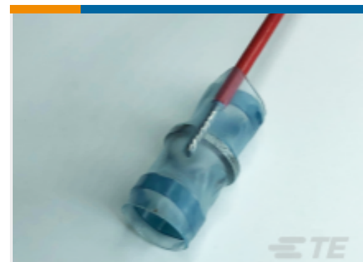
TE 产品编号754095-000 D-146-50-0