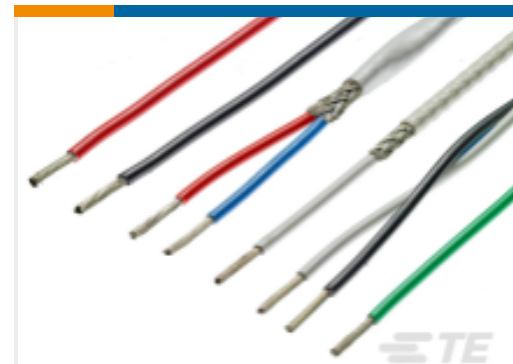
TE 产品编号127025-000 44B1141-20-MST4-9CS2275