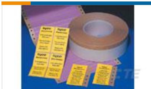
TE 产品编号096394-000 TTVF400WE-100