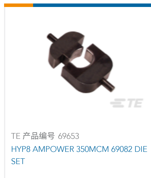
TE 产品编号 69653 HYP8 AMPOWER 350MCM 69082 DIE SET