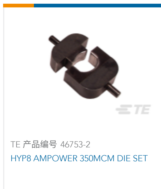
TE 产品编号 46753-2 HYP8 AMPOWER 350MCM DIE SET