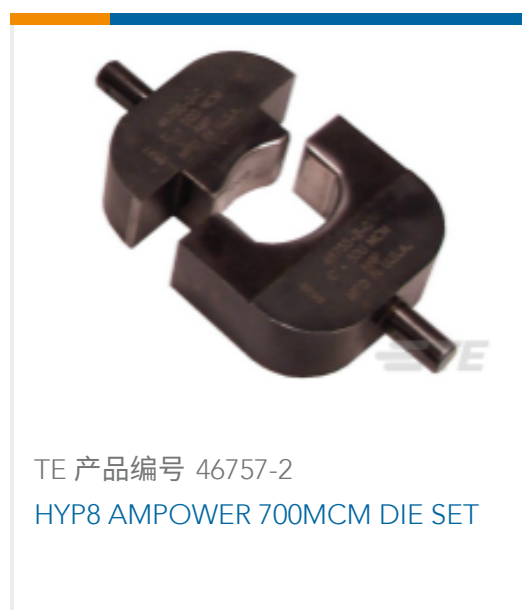
TE 产品编号 46757-2 HYP8 AMPOWER 700MCM DIE SET