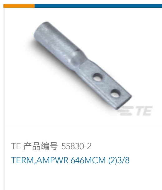
TE 产品编号 55830-2 TERM,AMPWR 646MCM (2)3/8