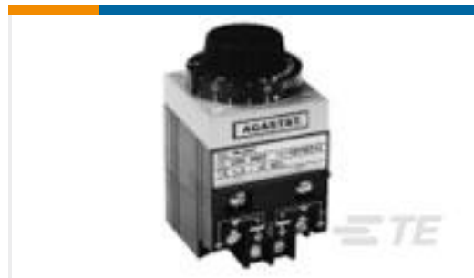
TE 产品编号1-1423162-2 7022AH=RLY,STD,OFF,2P,120VAC,3