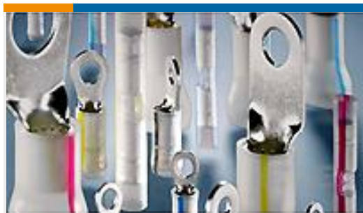
TE 产品编号53417-1 TERMINAL,PIDG PVF2 R 16-14 8