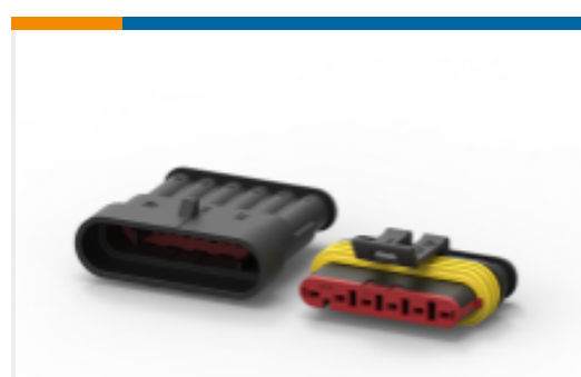
TE 产品编号282104-1 AMP SUPERSEAL 1.5MM, 连接器壳体