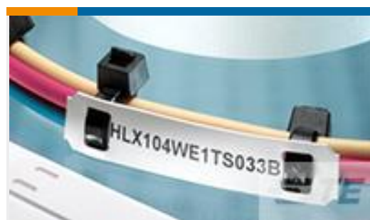
TE 产品编号EC7659-000 HLX253WE1TS050B