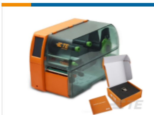
TE 产品编号1-2186501-1 T3212-SWARE-PRINTER