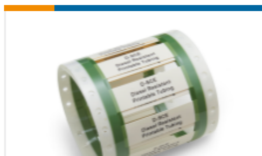
TE 产品编号872083-000 D-SCE Fluid Resistant Sleeves