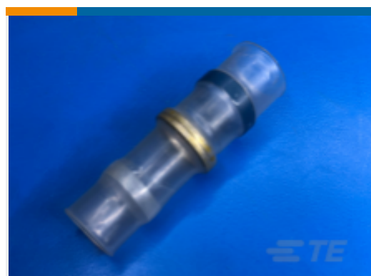
TE 产品编号D18609-000 B-155-07-F