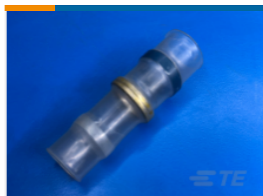
TE 产品编号F33138-000 B-155-07-S