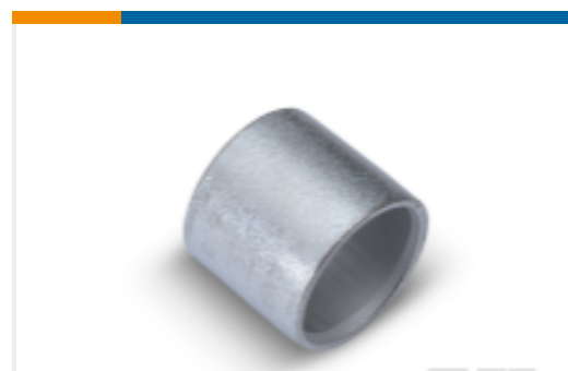
TE 产品编号324445 AMPOWER Parallel Splice