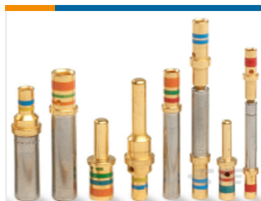
TE 产品编号ZPF000000000001248 097-0216-16 TRA