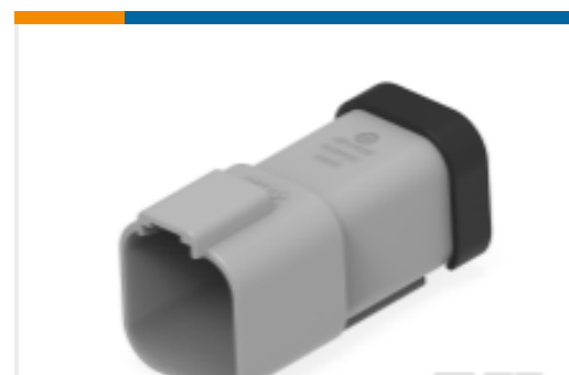
TE 产品编号DT04-6P-C017 REC, 6P, GRY, BLOCKED