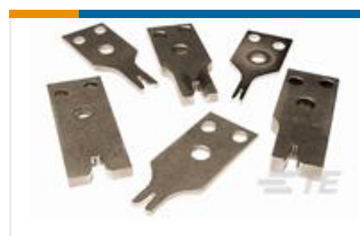
TE 产品编号4-456135-9 CRIMPER, INSULATION "O"(.180")