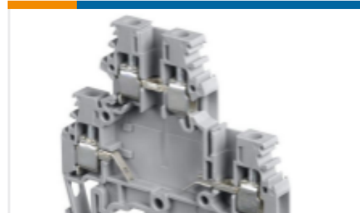
TE 产品编号1SNA115177R1400 M4/6.DE1