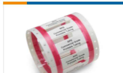
TE 产品编号3234330001 RPS Commercial Grade Sleeves