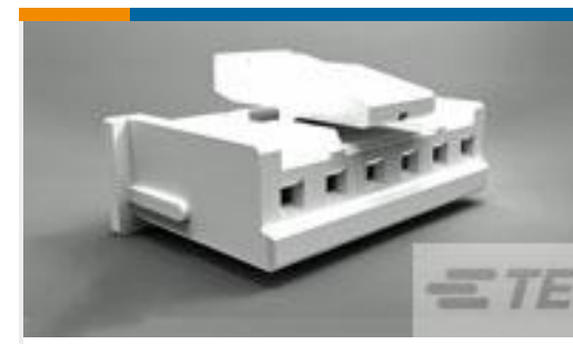
TE 产品编号1744417-3 3 POS EP 2.5 HSG, GLOW WIRE