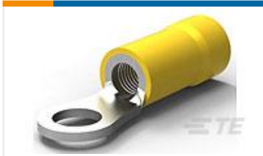
TE 产品编号330518 TERMINAL,PG R 12-10 10