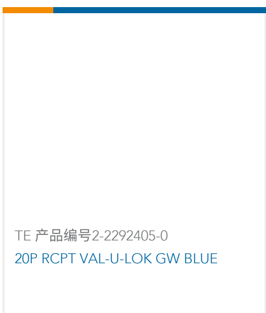
TE 产品编号2-2292405-0 20P RCPT VAL-U-LOK GW BLUE