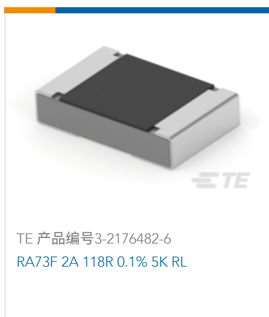
TE 产品编号3-2176482-6 RA73F 2A 118R 0.1% 5K RL