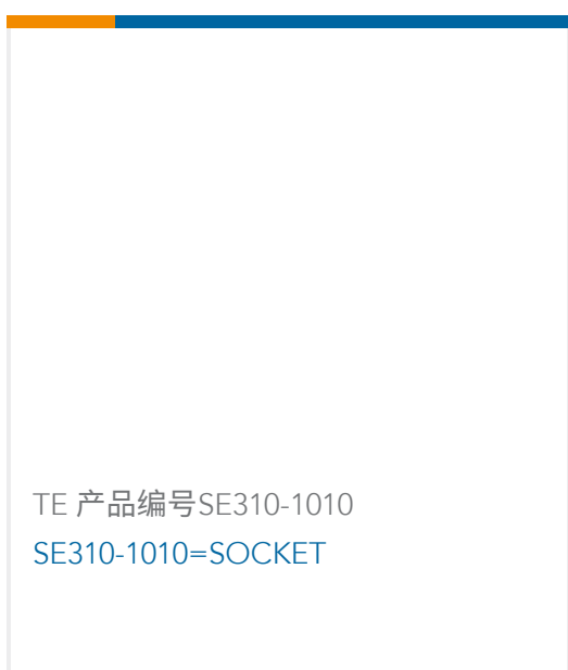
TE 产品编号SE310-1010 SE310-1010=SOCKET