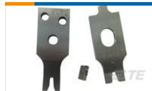
TE 产品编号7-2151014-7 OCEAN_2.0_SPARE_PART_KIT-042F048O