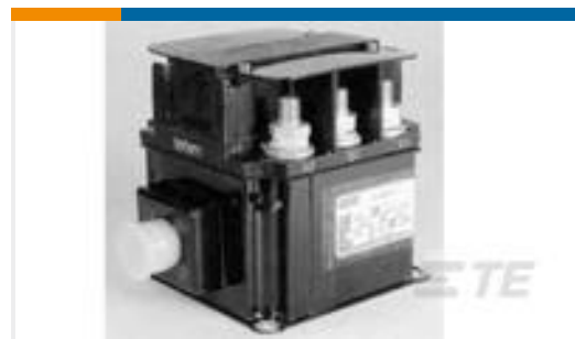
TE 产品编号1616023-1 B4301 (FAA/PMA)=RELAY