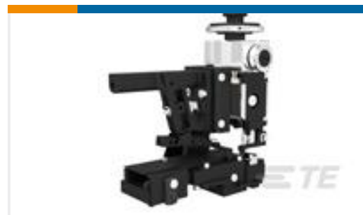
TE 产品编号2151014-1 OCEAN_2.0_APPLICATOR-S-042F048O-RSM