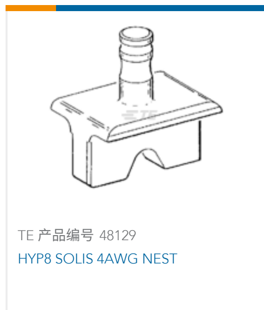
TE 产品编号 48129 HYP8 SOLIS 4AWG NEST