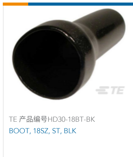
TE 产品编号 HD30-18BT-BK BOOT, 18SZ, ST, BLK