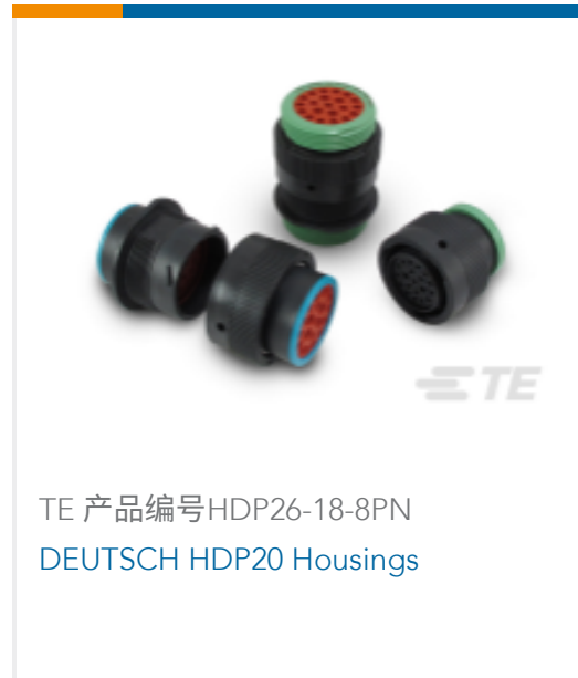
TE 产品编号 HDP26-18-8PN DEUTSCH HDP20 Housings