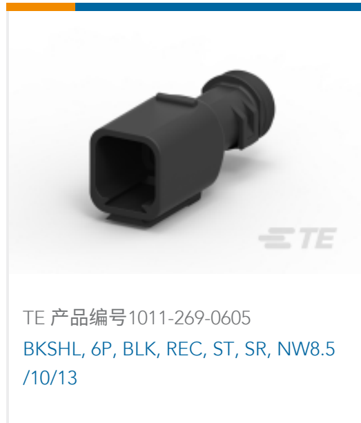
TE 产品编号 1011-269-0605 BKSHL, 6P, BLK, REC, ST, SR, NW8.5 /10/13