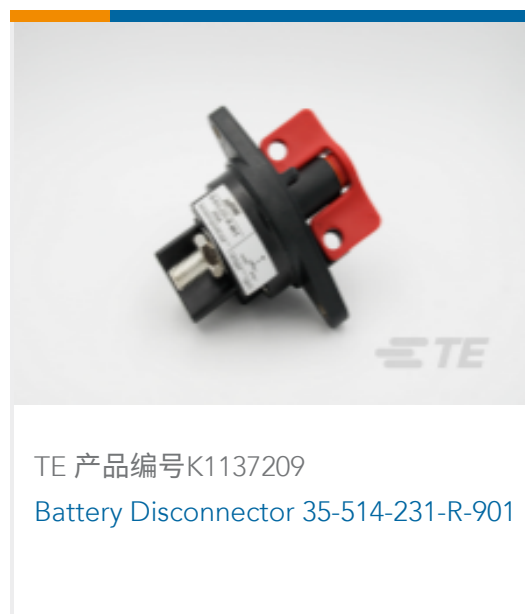
TE 产品编号 K1137209 Battery Disconnect 35-514-231-R-901