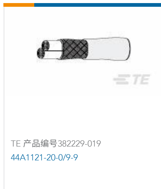
TE 产品编号 382229-019 44A1121-20-0/9-9