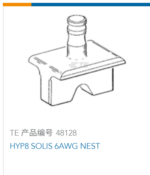
TE 产品编号 48128 HYP8 SOLIS 6AWG NEST