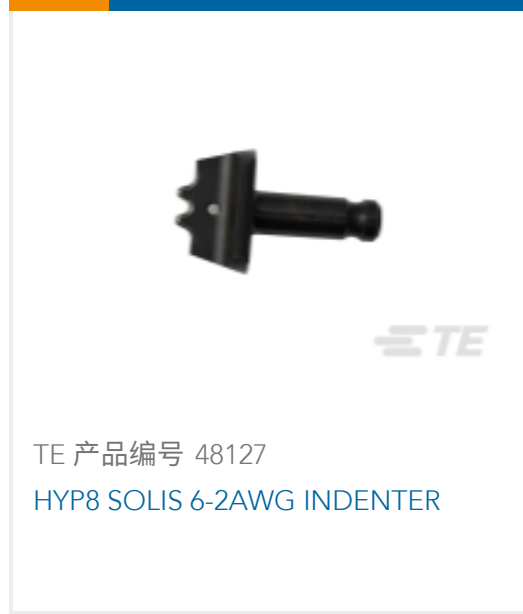
TE 产品编号 48127 HYP8 SOLIS 6-2AWG INDENTER