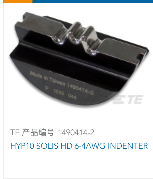
TE 产品编号 1490414-2 HYP10 SOLIS HD 6-4AWG INDENTER