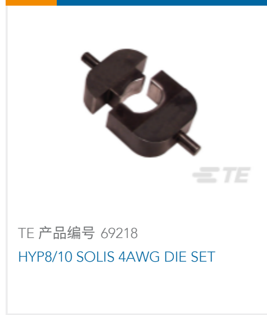
TE 产品编号 69218 HYP8/10 SOLIS 4AWG DIE SET