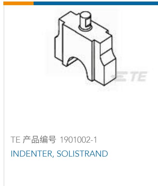
TE 产品编号 1901002-1 INDENTER, SOLISTRAND