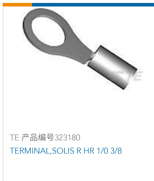
TE 产品编号 323180 TERMINAL, SOLIS R HR 1/0 3/8