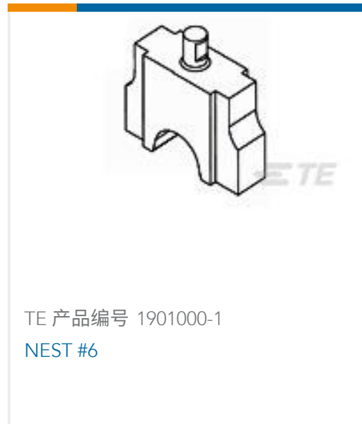
TE 产品编号 1901000-1 NEST #6