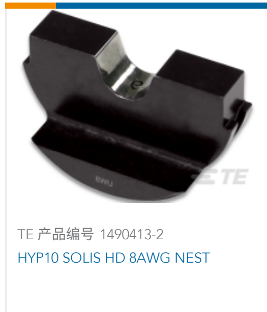
TE 产品编号 1490413-2 HYP10 SOLIS HD 8AWG NEST