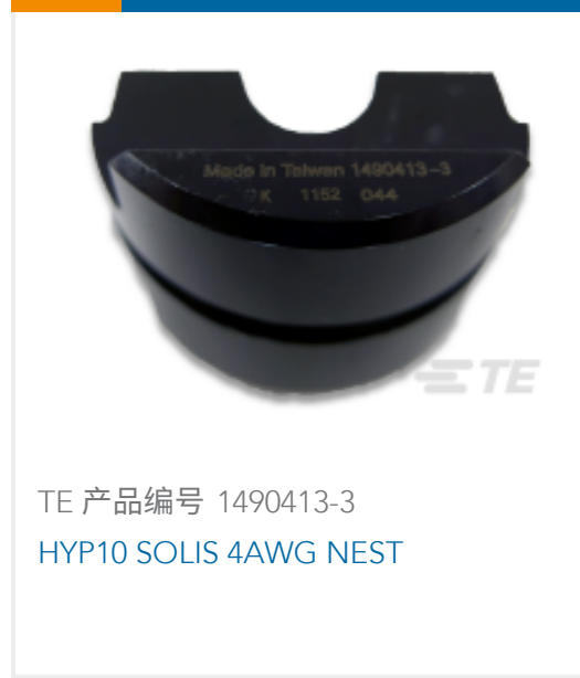
TE 产品编号 1490413-3 HYP10 SOLIS 4AWG NEST