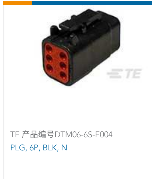
TE 产品编号 DTM06-6S-E004 PLG, 6P, BLK, N