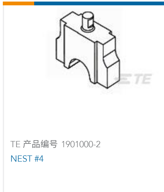
TE 产品编号 1901000-2 NEST #4