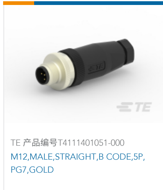
TE 产品编号 T4111401051-000 M12, MALE, STRAIGHT, B CODE, 5P, PG7, GOLD