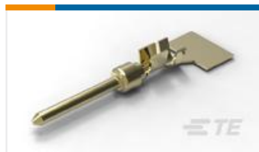
TE 产品编号66506-9 PIN CONTACT, 20 DF