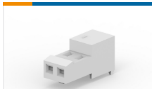
TE 产品编号4-640441-0 MTA Receptacle: Nylon, Tin Plated, 2.54 mm