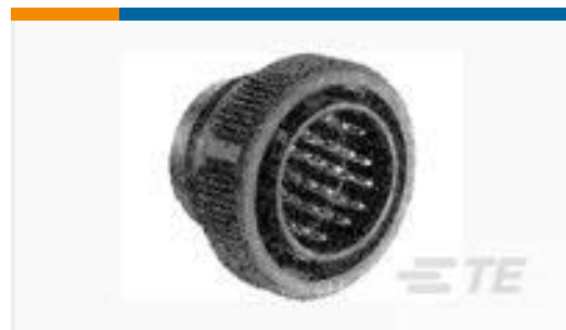
TE 产品编号206039-1 CPC PLUG ASSEMBLY SIZE 17-28