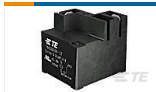
TE 产品编号3-1393210-3 T9AS5D12-12