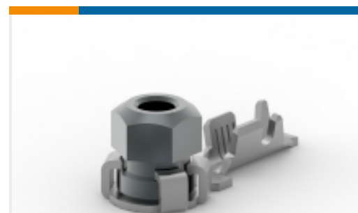
TE 产品编号2050842-1 Assy' Terminal Ring Tongue M4