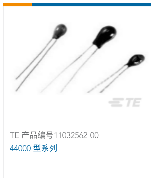
TE 产品编号 11032562-00 44000 型系列