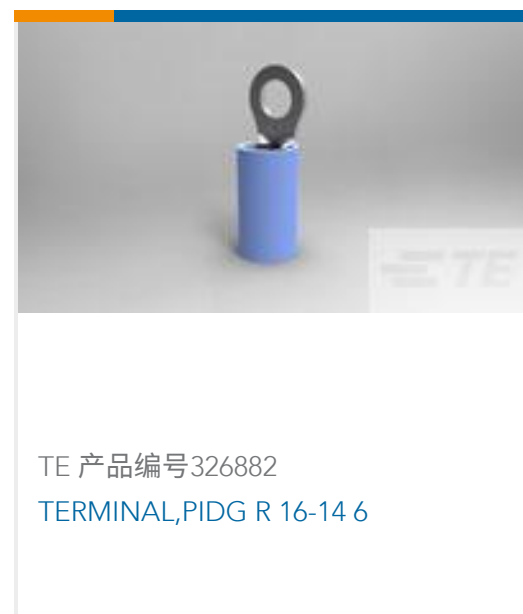
TE 产品编号 326882 TERMINAL,PIDG R 16-14 6