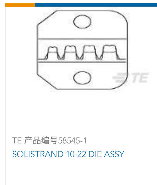
TE 产品编号 58545-1 SOLISTRAND 10-22 DIE ASSY