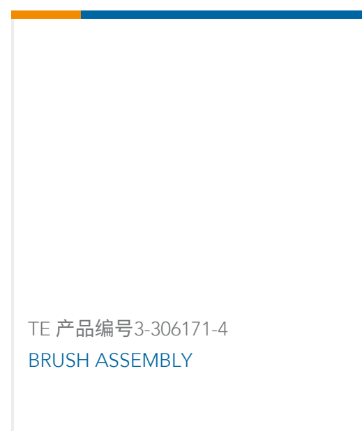
TE 产品编号 3-306171-4 BRUSH ASSEMBLY