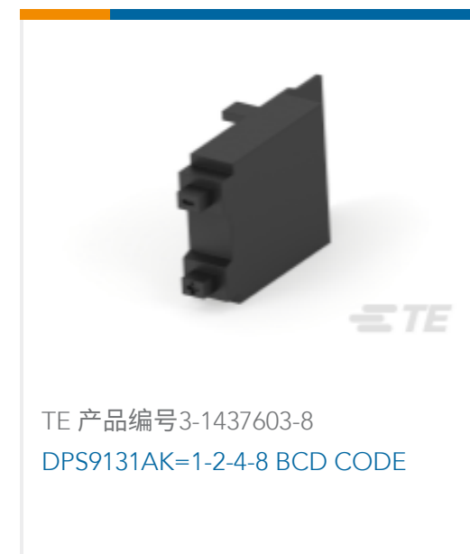
TE 产品编号 3-1437603-8 DPS9131AK=1-2-4-8 BCD CODE