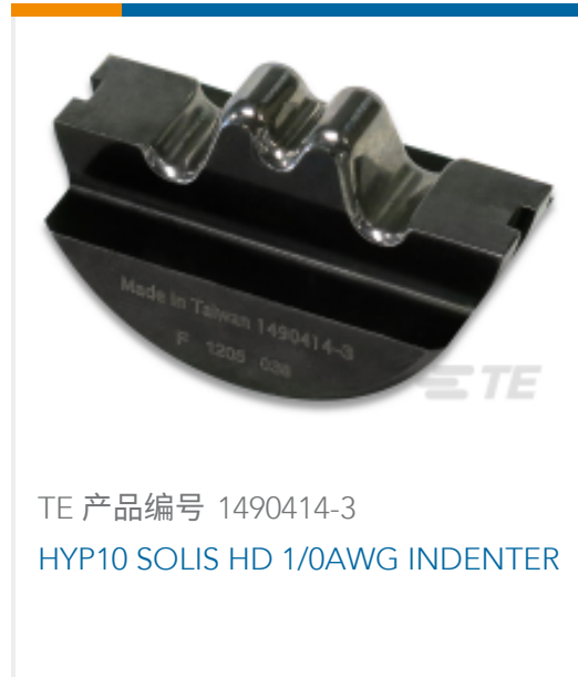
TE 产品编号 1490414-3 HYP10 SOLIS HD 1/0AWG INDENTER