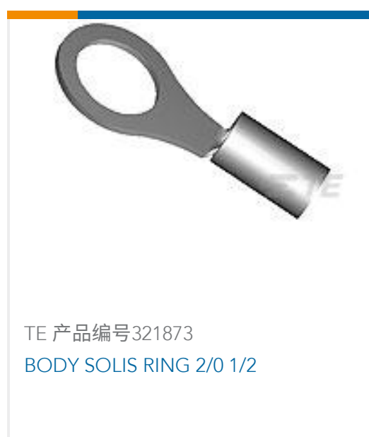
TE 产品编号 321873 BODY SOLIS RING 2/0 1/2