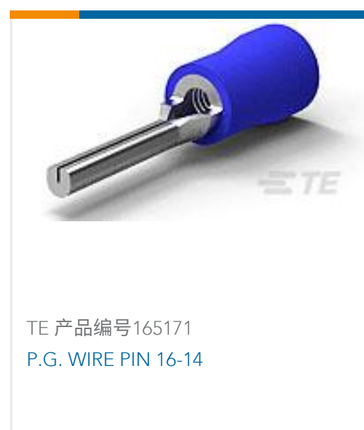
TE 产品编号 165171 P.G. WIRE PIN 16-14