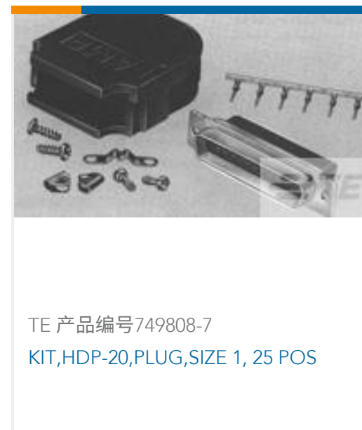
TE 产品编号 749808-7 KIT,HDP-20,PLUG,SIZE 1, 25 POS