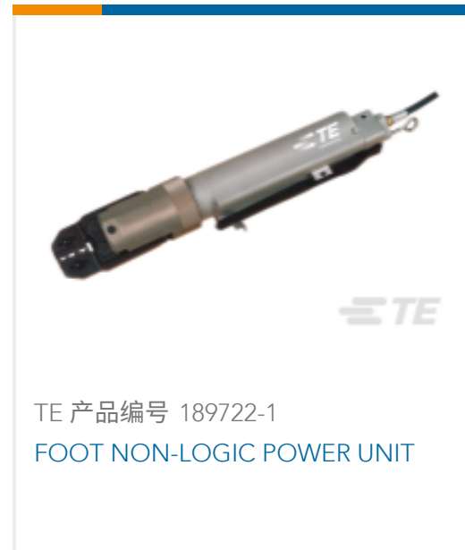
TE 产品编号 189722-1 FOOT NON-LOGIC POWER UNIT