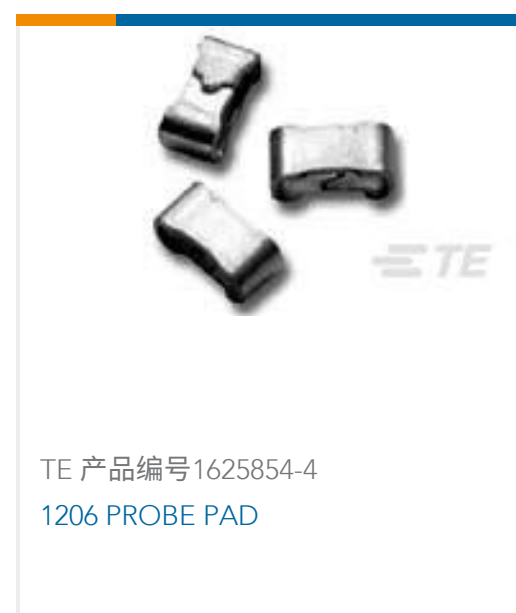
TE 产品编号 1625854-4 1206 PROBE PAD