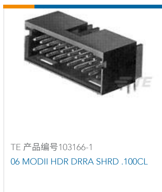
TE 产品编号 103166-1 06 MODII HDR DRRA SHRD .100CL