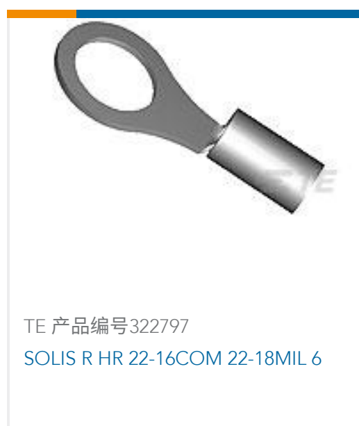
TE 产品编号 322797 SOLIS R HR 22-16COM 22-18MIL 6