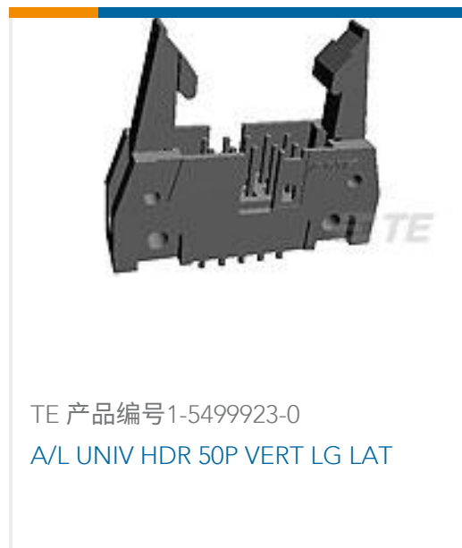
TE 产品编号 1-5499923-0 A/L UNIV HDR 50P VERT LG LAT