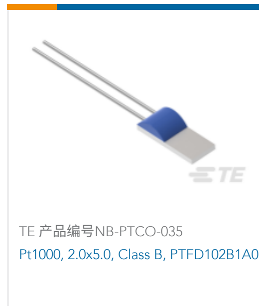
TE 产品编号 NB-PTCO-035 Pt1000, 2.0x5.0, Class B, PTFD102B1A0