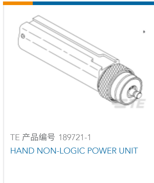
TE 产品编号 189721-1 HAND NON-LOGIC POWER UNIT