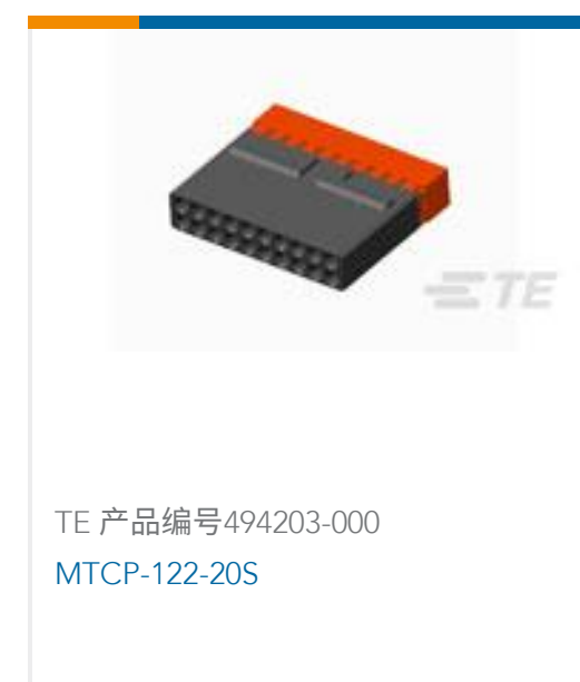
TE 产品编号 494203-000 MTCP-122-20S