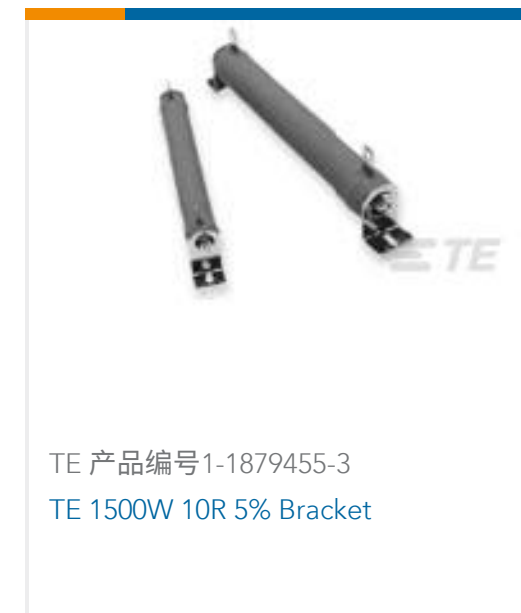
TE 产品编号 1-1879455-3 TE 1500W 10R 5% Bracket