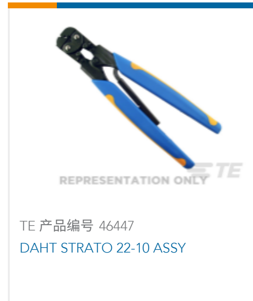
TE 产品编号 46447 DAHT STRATO 22-10 ASSY