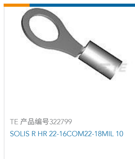
TE 产品编号 322799 SOLIS R HR 22-16COM22-18MIL 10