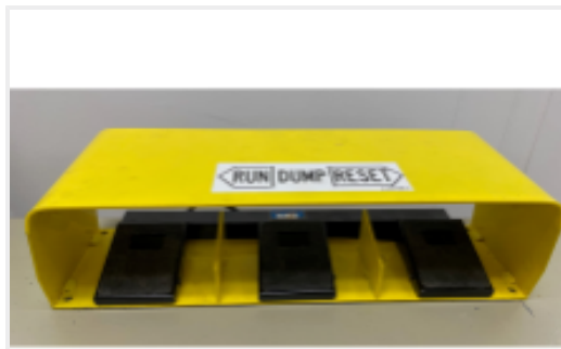
TE 产品编号68284-1 HYP10 3PEDAL FOOT CTRL