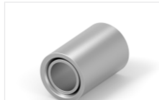
TE 产品编号CAT-C7901-AL8206 COPALUM 绞线/实心：并行接头