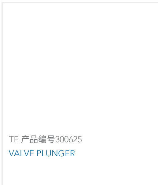
TE 产品编号300625 VALVE PLUNGER