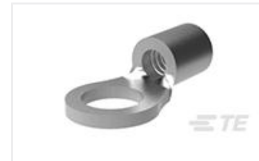
TE 产品编号33458 TERMINAL,SOLIS R 12-10 1/4