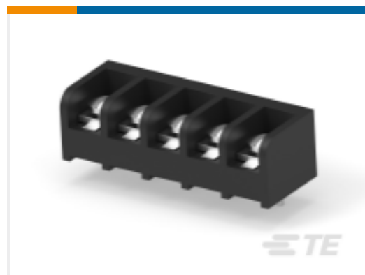
TE 产品编号796607-1 4PCV-05-397=.325" TRI BARRIER S