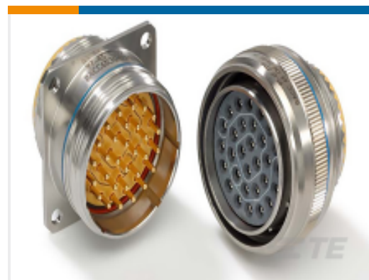
TE 产品编号ZPF000000000114632 983-6SE 22-39 PN