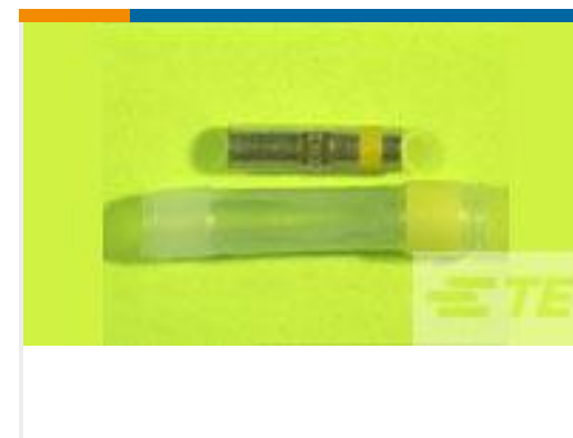
TE 产品编号650195-000 D-436-0136