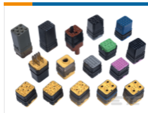
TE 产品编号ZPF00000000015255 DMC-M 12-20 ANE