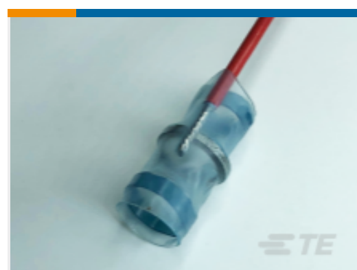
TE 产品编号265725N001 D-146-0230CS1370