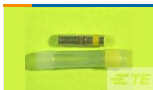
TE 产品编号650196-000 D-436-0137