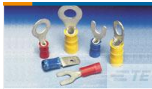
TE 产品编号322313 TERMINAL,PI FLAG R 16-14HD 14