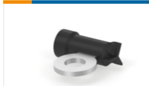
TE 产品编号322511-1 PG, RING TONGUE, FLAG, #14, HD 16-14