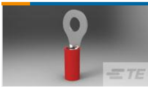
TE 产品编号320571 PIDG R 22-16 COMM 22-18MIL 1/4