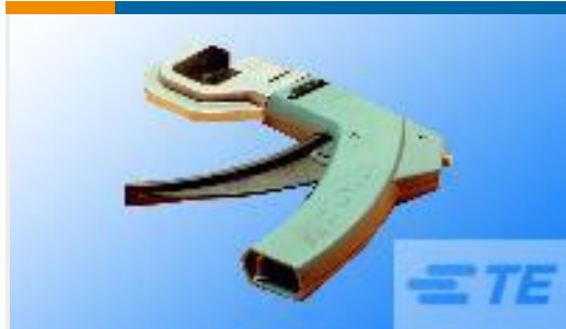
TE 产品编号58579-1 MTA 100 MANUAL TOOL ASSEMBLY DISCRETE