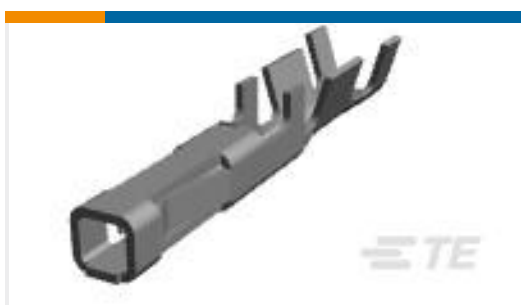
TE 产品编号1-794610-1 MICRO MNL RPT CNT,LS PC 15AU L