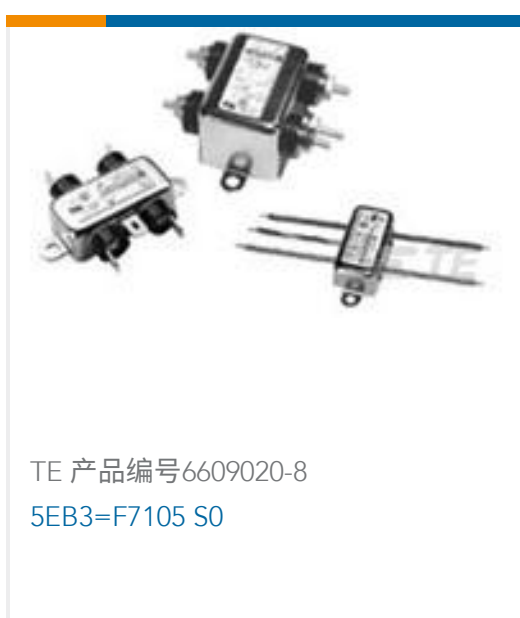
TE 产品编号6609020-8 5EB3=F7105 S0