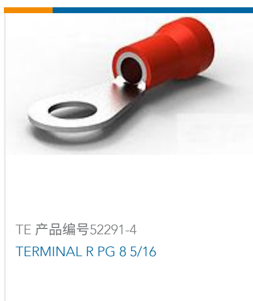
TE 产品编号52291-4 TERMINAL R PG 8 5/16