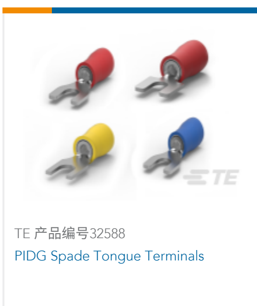
TE 产品编号32588 PIDG Spade Tongue Terminals