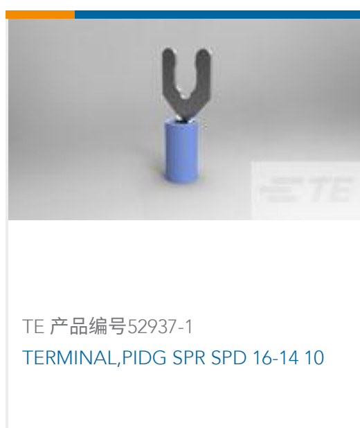
TE 产品编号52937-1 TERMINAL,PIDG SPR SPD 16-14 10