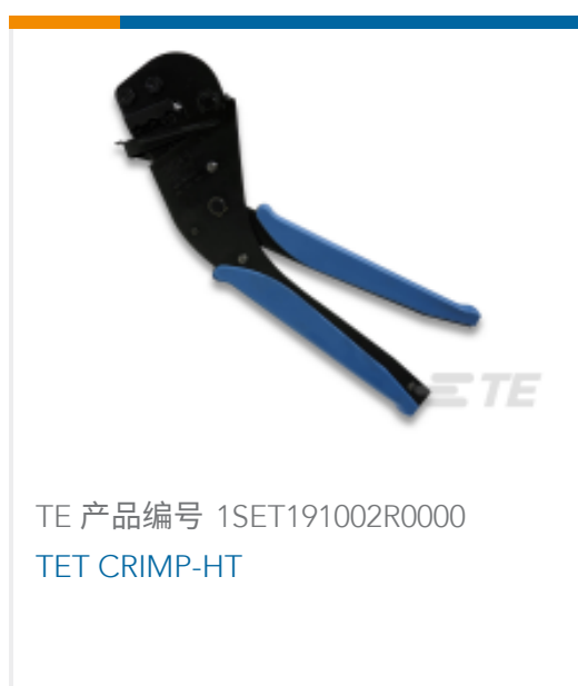
TE 产品编号 1SET191002R0000 TET CRIMP-HT