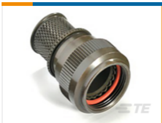
TE 产品编号EK4901-000 BTH1-25-16-1-B-SB