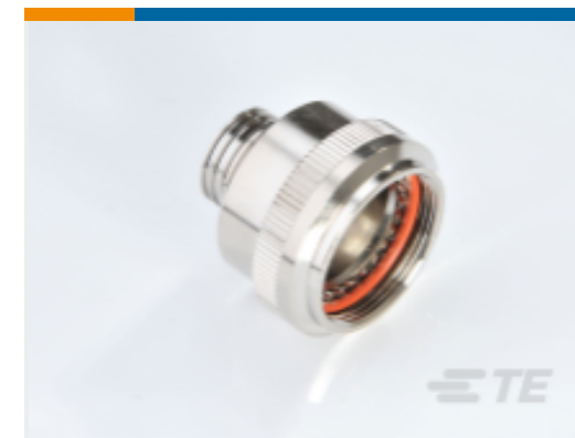
TE 产品编号70F1-20-18-1-B 70F1-20-18-1-B