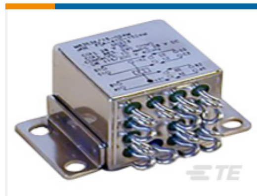
TE 产品编号5-1617815-2 TD229-5002P=TDFR 50 SEC M83726 /29-5002P