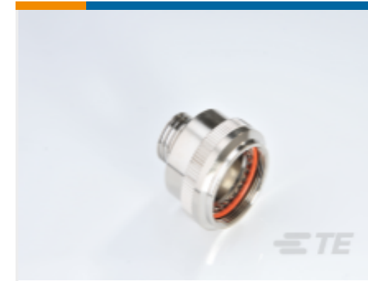
TE 产品编号70A1-12-07-1-B 70A1-12-07-1-B