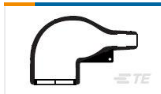
TE 产品编号878512-000 222K132-25-0