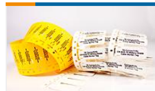
TE 产品编号A11348-000 HTCM-SCE-TP-1/4-4H-9