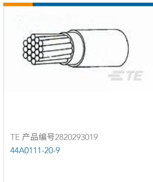
TE 产品编号2820293019 44A0111-20-9