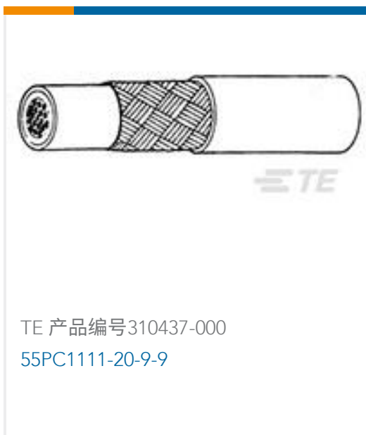
TE 产品编号310437-000 55PC1111-20-9-9