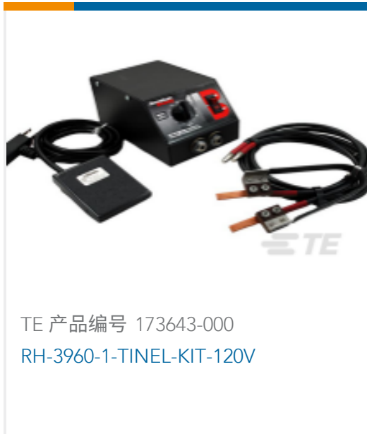
TE 产品编号 173643-000 RH-3960-1-TINEL-KIT-120V