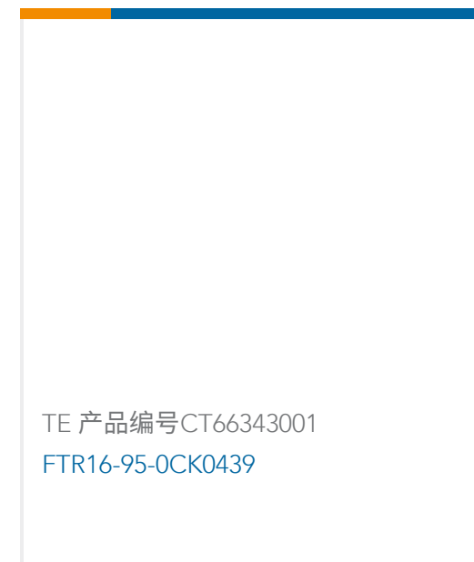
TE 产品编号CT66343001 FTR16-95-0CK0439