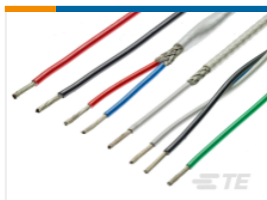
TE 产品编号2611473001 44A0111-12-54