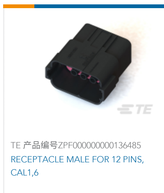
TE 产品编号ZPF000000000136485 RECEPTACLE MALE FOR 12 PINS, CAL1,6