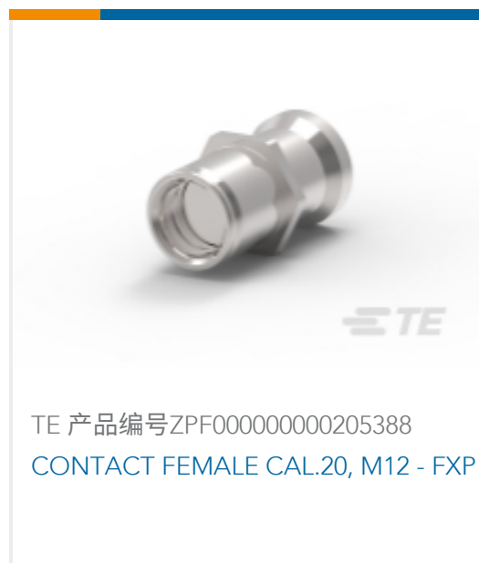
TE 产品编号ZPF000000000205388 CONTACT FEMALE CAL.20, M12 - FXP