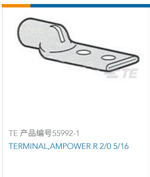
TE 产品编号55992-1 TERMINAL, AMPOWER R 2/0 5/16