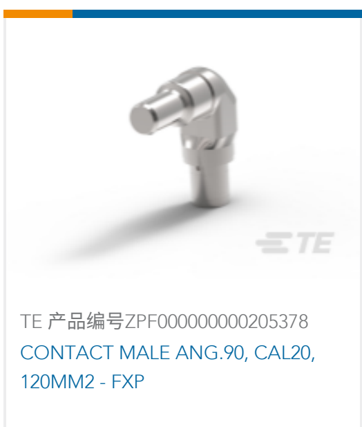
TE 产品编号ZPF000000000205378 CONTACT MALE ANG.90, CAL20, 120MM2 - FXP