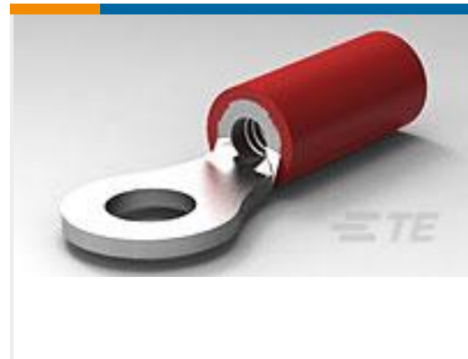
TE 产品编号34144 PG R 22-16 COMM 22-18 MIL 6