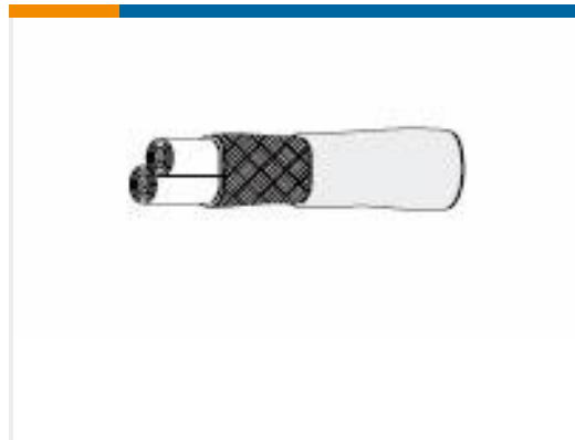
TE 产品编号205175-000 55A1122-22-6/9-9