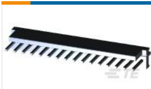
TE 产品编号1-640454-6 16P MTA100 HDR ASSY SQ STR POL