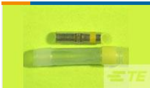
TE 产品编号 650075-000 D-436-37