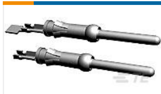
TE 产品编号1-66106-5 III+ PIN,26-24,TIN,STRIP