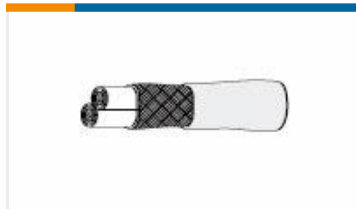
TE 产品编号811607-000 55A1121-18-9/96-9CS2275