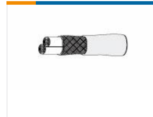
TE 产品编号450931-000 55A1121-16-0/9-0