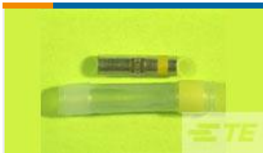
TE 产品编号 650076-000 D-436-38