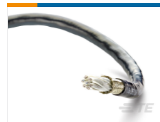
TE 产品编号CD48153001 VG-95218-T020-E11G