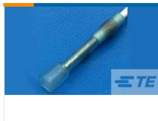
TE 产品编号695296-000 B-802-06