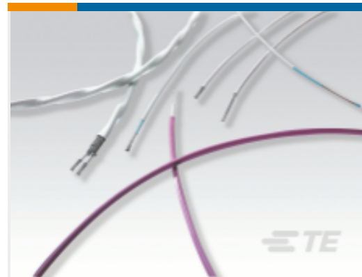
TE 产品编号EM7448-000 General Purpose Hookup Wire: Tin Coated Copper Wire, 0-8 AWG