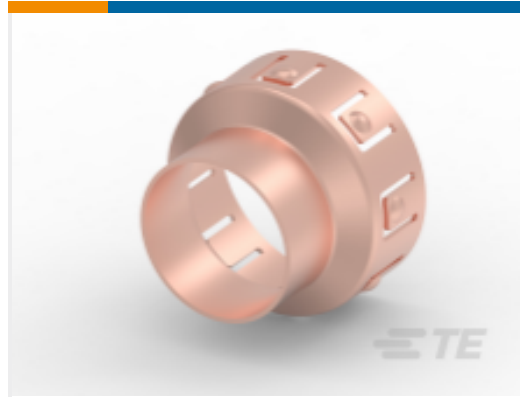
TE 产品编号2355150-2 SLEEVE,IPT 3P SHIELDING