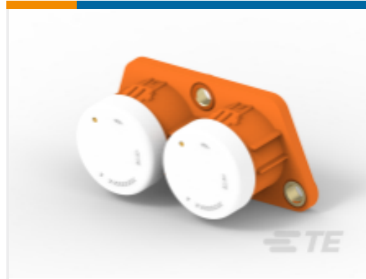
TE 产品编号2371017-1 2POS,IPT,RING TONGUE HSG ASSY, SLD