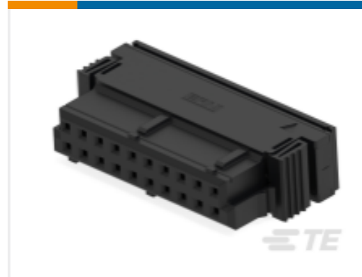
TE 产品编号374335-E DRBUG B 2,54 20 * CSI 112 E012 ADV J 2