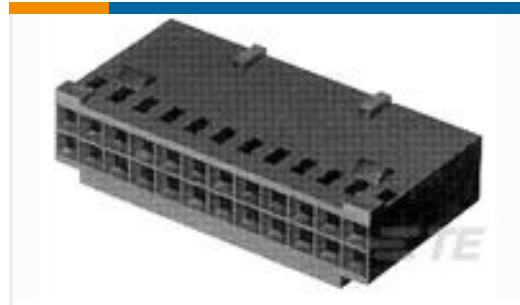
TE 产品编号3-87631-5 40 MODIV HSG COMP DR .100 POL