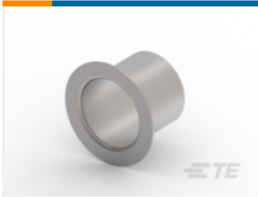
TE 产品编号2355148-1 SLEEVE,IPT 3P SHIELDING