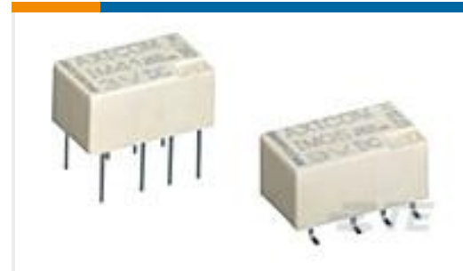
TE 产品编号 1462039-4 IM13GR=IM RELAY 100mW 5V