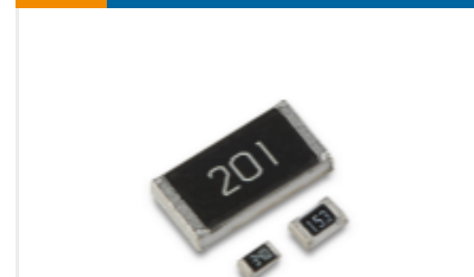
TE 产品编号 5-2176326-1 CRGP 0603 150K 1%