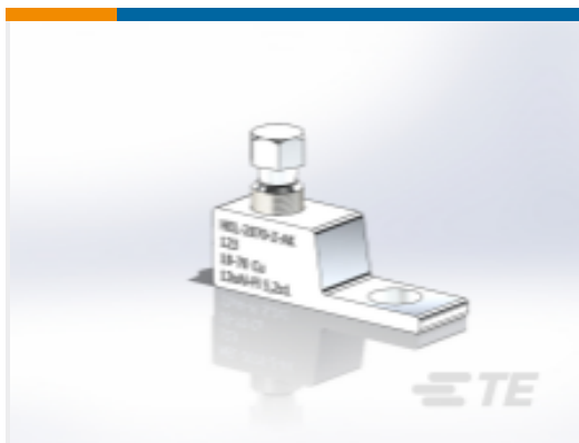
TE 产品编号 E94665-000 HEL-2070-Z-AK