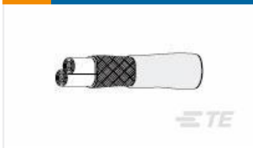
TE 产品编号 3822863005 44A1121-22-2/6-9