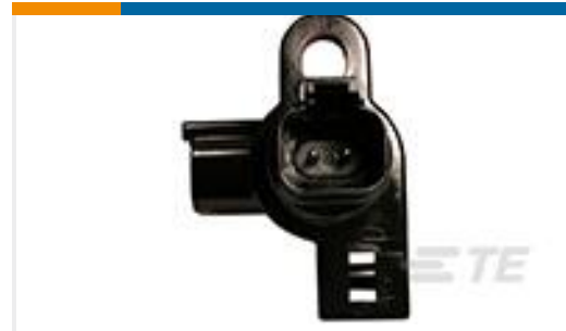
TE 产品编号 DT04-2P-N006 REC, 2P, BLK, FEEDTHRU, NI