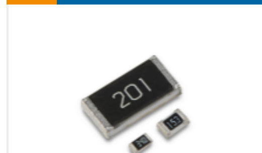
TE 产品编号 5-2176326-0 CRGP 0603 120K 1%