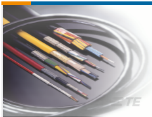
TE 产品编号1107903001 100G0111-4.00-0CK0042/1