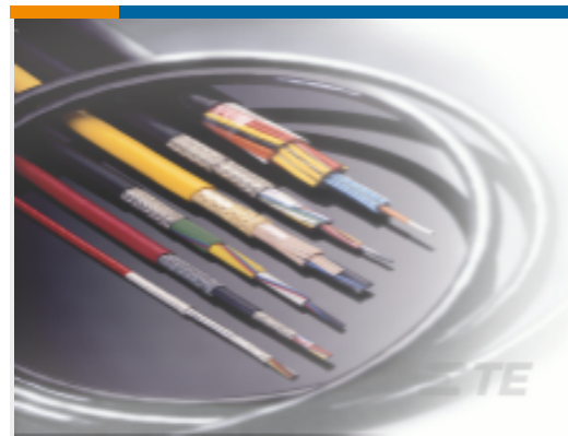
TE 产品编号CD34883001 100G1131-1.20-F978CK0042