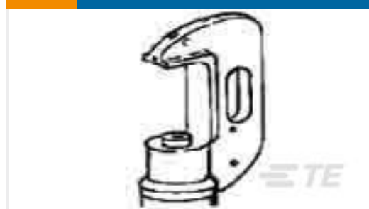
TE 产品编号69082 HYP8 4/0-1000MCM 26T HEAD