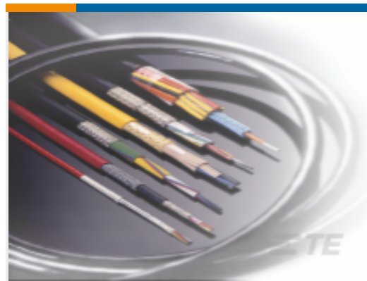
TE 产品编号CD26913001 100G1131-0.75-F974CK0042