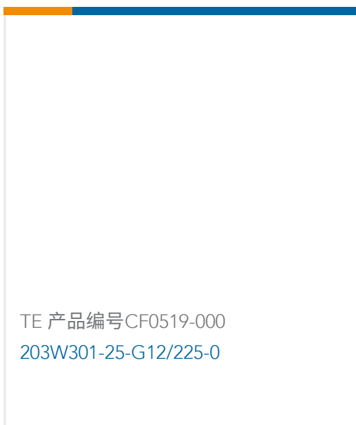
TE 产品编号CF0519-000 203W301-25-G12/225-0