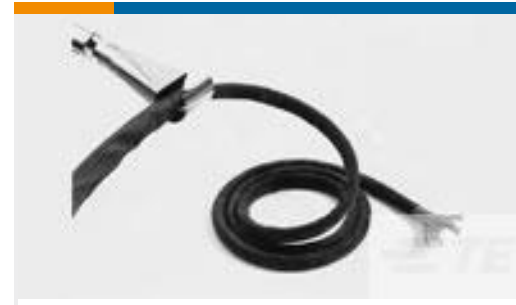
TE 产品编号CB03314003 RW-200-E-3/16-0-SP