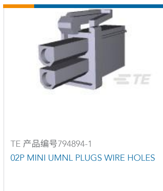
TE 产品编号794894-1 02P MINI UMNL PLUGS WIRE HOLES