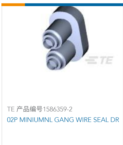
TE 产品编号1586359-2 02P MINIUMNL GANG WIRE SEAL DR