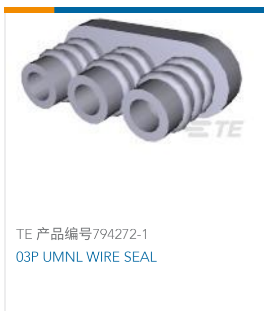
TE 产品编号794272-1 03P UMNL WIRE SEAL