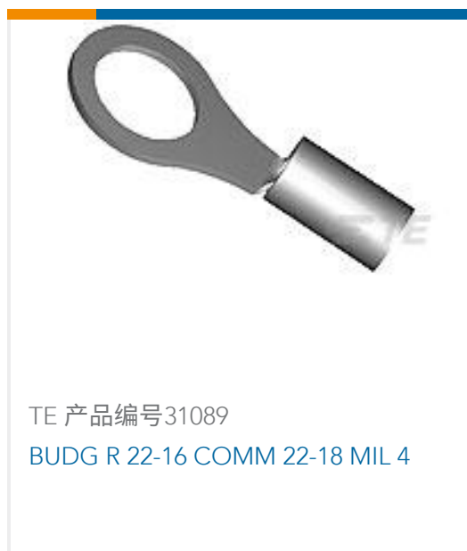
TE 产品编号31089 BUDG R 22-16 COMM 22-18 MIL 4