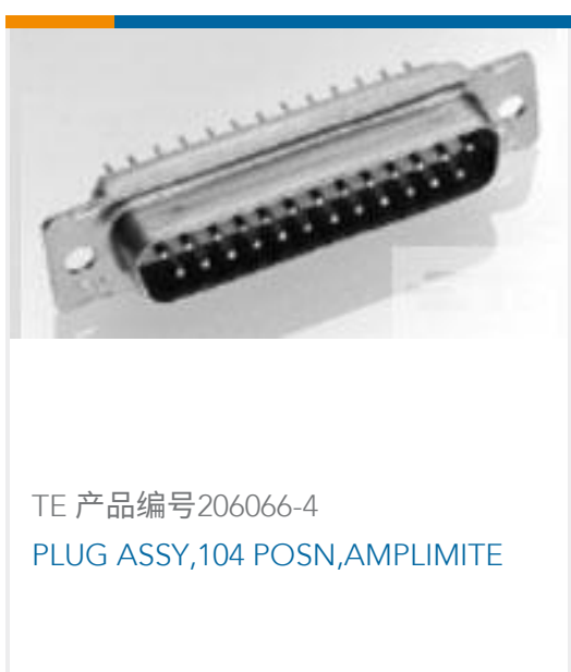
TE 产品编号206066-4 PLUG ASSY,104 POSN,AMPLIMITE