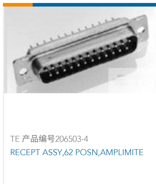
TE 产品编号206503-4 RECEIPT ASSY,62 POSN,AMPLIMITE