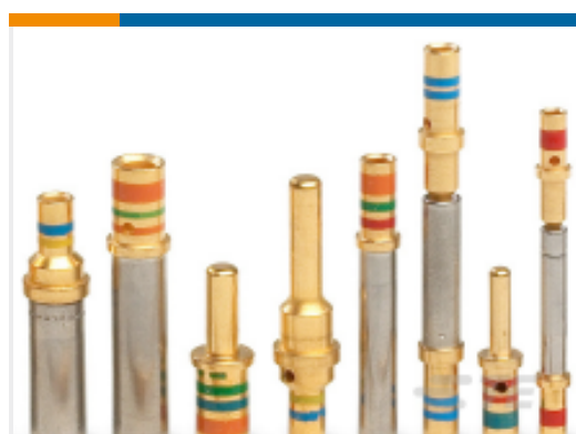
TE 产品编号ZPF000000000000343 006-0912-20 SCC