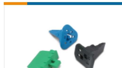
TE 产品编号W2S Wedgelocks: DEUTSCH DT