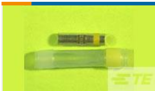
TE 产品编号 650075-000 D-436-37