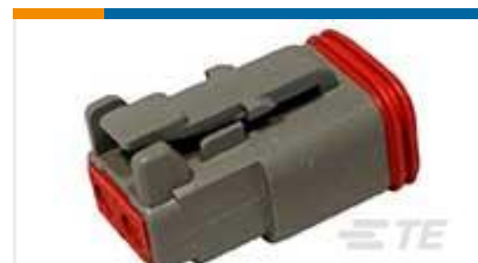
TE 产品编号DT06-2S PLG, 2P, GRY, N