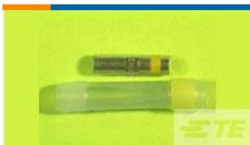
TE 产品编号 650076-000 D-436-38