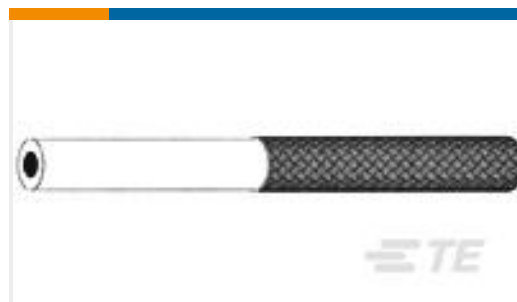
TE 产品编号A513413001 RAY-101-6.0(100)