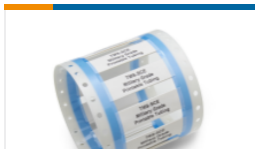
TE 产品编号5273550001 TMS-SCE Military Grade Sleeves